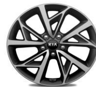
Cerchi in lega da 18" 225/45R18