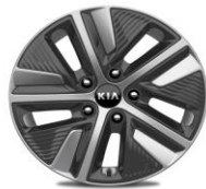
Cerchi in lega da 16" 205/60R16