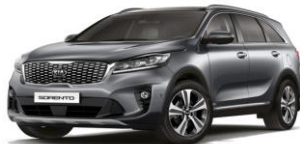
Steel Grey (KLG)