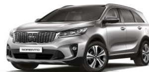
Silky Silver (45S)