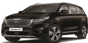
Rich Espresso (DN9)