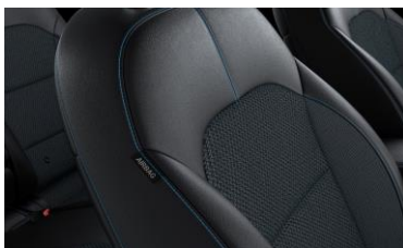
Sedili in misto pelle/tessuto