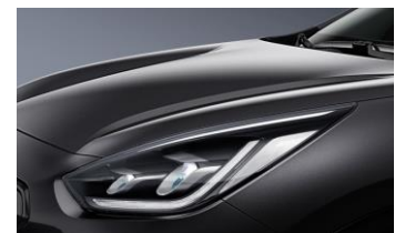
Interstellar Gray (AGT)