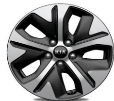
Cerchi in Lega da 17" 215/55 R17