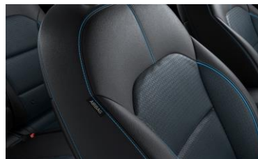
Sedili in pelle