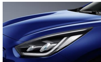
Yacht Blue (DU3)