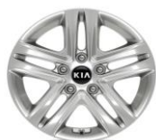
Cerchi in lega da 16" 205/55 R16