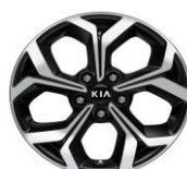
Cerchi in lega da 17" 225/45 R17