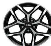
Cerchi in lega da 17" 225/45 R17 GT Line