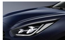
Gravity Blue (B4U)