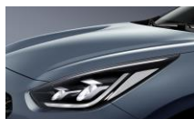
Horizon Blue (BBL)