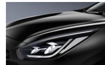
Aurora Black Pearl (ABP)