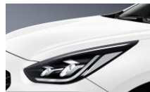
Clear White (UD)