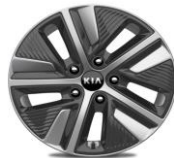
Cerchi in lega da 16" 205/60R16