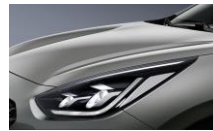
Steel Gray (KLG)