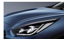
Cerulean Blue (C3U)