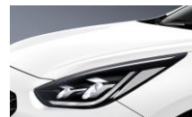
Snow White Pearl (SWP)