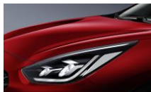
Runway Red (CR5)