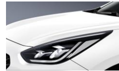
Snow White Pearl (SWP)