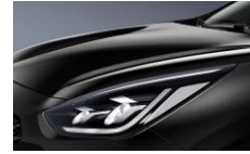
Aurora Black Pearl (ABP)