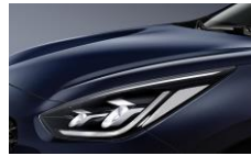
Gravity Blue (B4U)