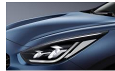
Cerulean Blue (C3U)