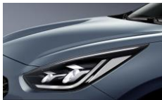
Horizon Blue (BBL)