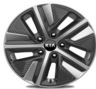
Cerchi in lega da 16" 205/60R16