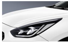
Clear White (UD)