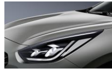
Steel Gray (KLG)