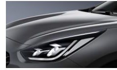
Platinum Graphite (ABT)