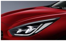
Runway Red (CR5)