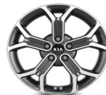
Cerchi in lega da 18" 235/45 R18