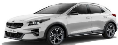
Cassa White (WD)