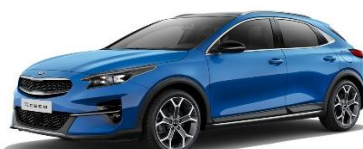
Blue Flame (B3L)