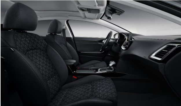
Interni in tessuto versione Urban