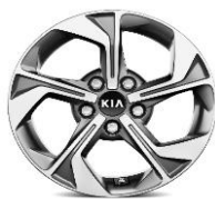
Cerchi in lega da 16" 205/60 R16