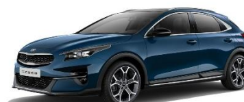
Cosmo Blue (CB7)