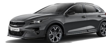
Dark Penta Metal (H8G)