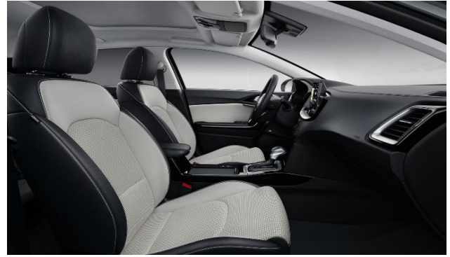
Interni in misto pelle e tessuto grigio/nero versioni Style e Evolution