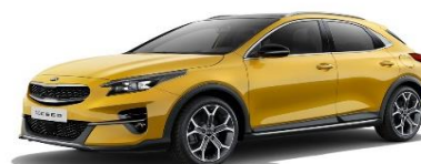
Quantum Yellow (YQM)