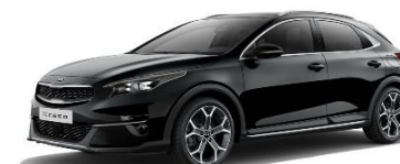
Aurora Black Pearl (1K)