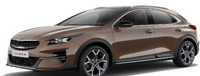
Copper Stone (L2B)