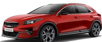
Infra Red (AA9)