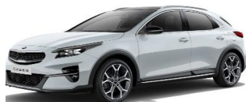
Deluxe White (HW2)