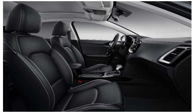
Interni in pelle disponibili con Lounge Pack