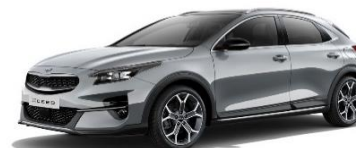
Lunar Silver (CSS)