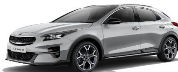
Sparkling Silver (KCS)