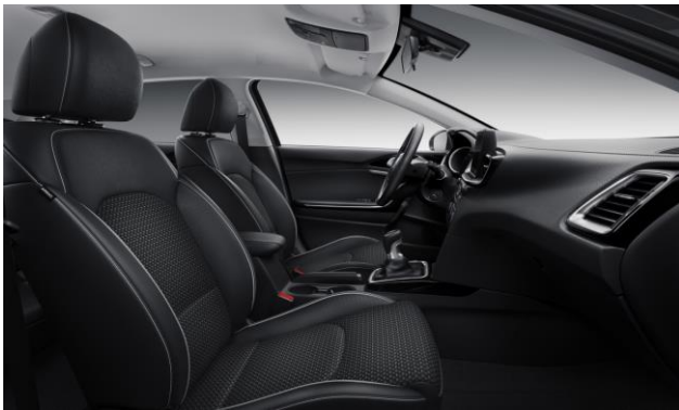
Interni in misto pelle e tessuto nero versioni Style, Evolution e High Tech