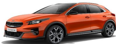
Orange Fusion (RNG)