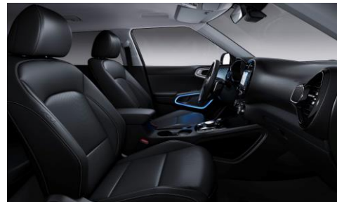
Sedili in pelle (SUV Pack)