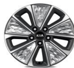
Cerchi in Lega da 17" 215/55 R17