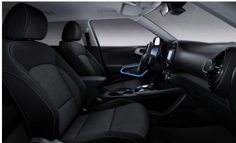
Sedili in tessuto di serie