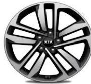
Cerchi in lega 19" 245/45R19