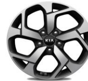
Cerchi in lega 17" 225/60R17