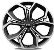
Cerchi in lega 19" GT Line 245/45R19