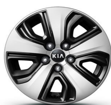
Cerchi in Lega leggera da 16" con cover aerodinamica 205/60R16