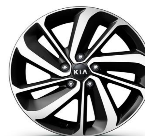
Cerchi in Lega da 18" 225/45R18 (solo per Hybrid)