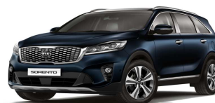
Gravity Blue (B4U)